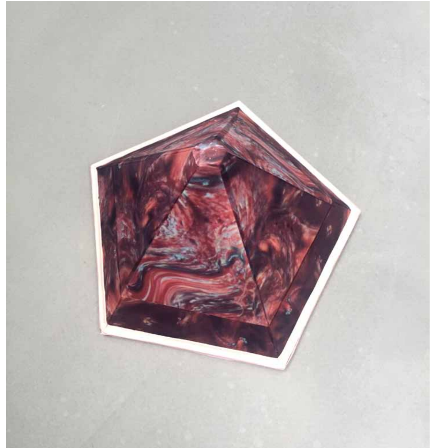
Placenta Pyramid, 2017 sugar on styrofoam Dimensions variable