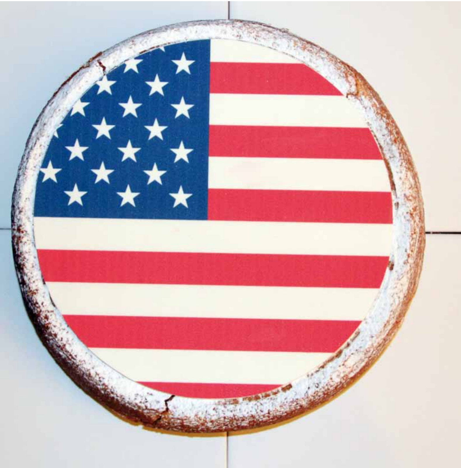
American Pie , 2013 Apfelkuchen, Zuckerplatte, Weisse Fliesen 22 cm ø