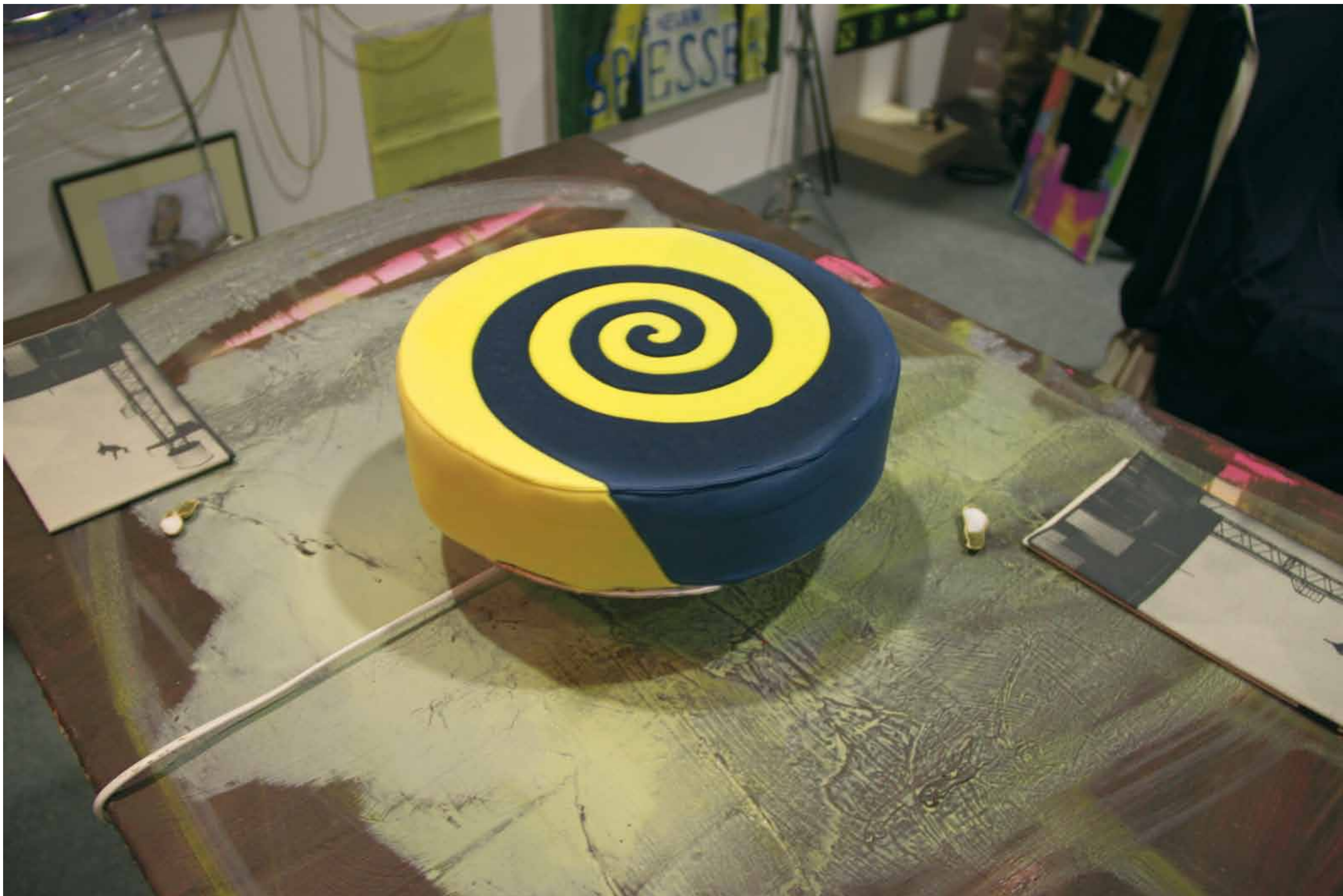
Ausstellungsansicht - DaDa Da Academy Restaurant, 2013 Art Athina, Athen