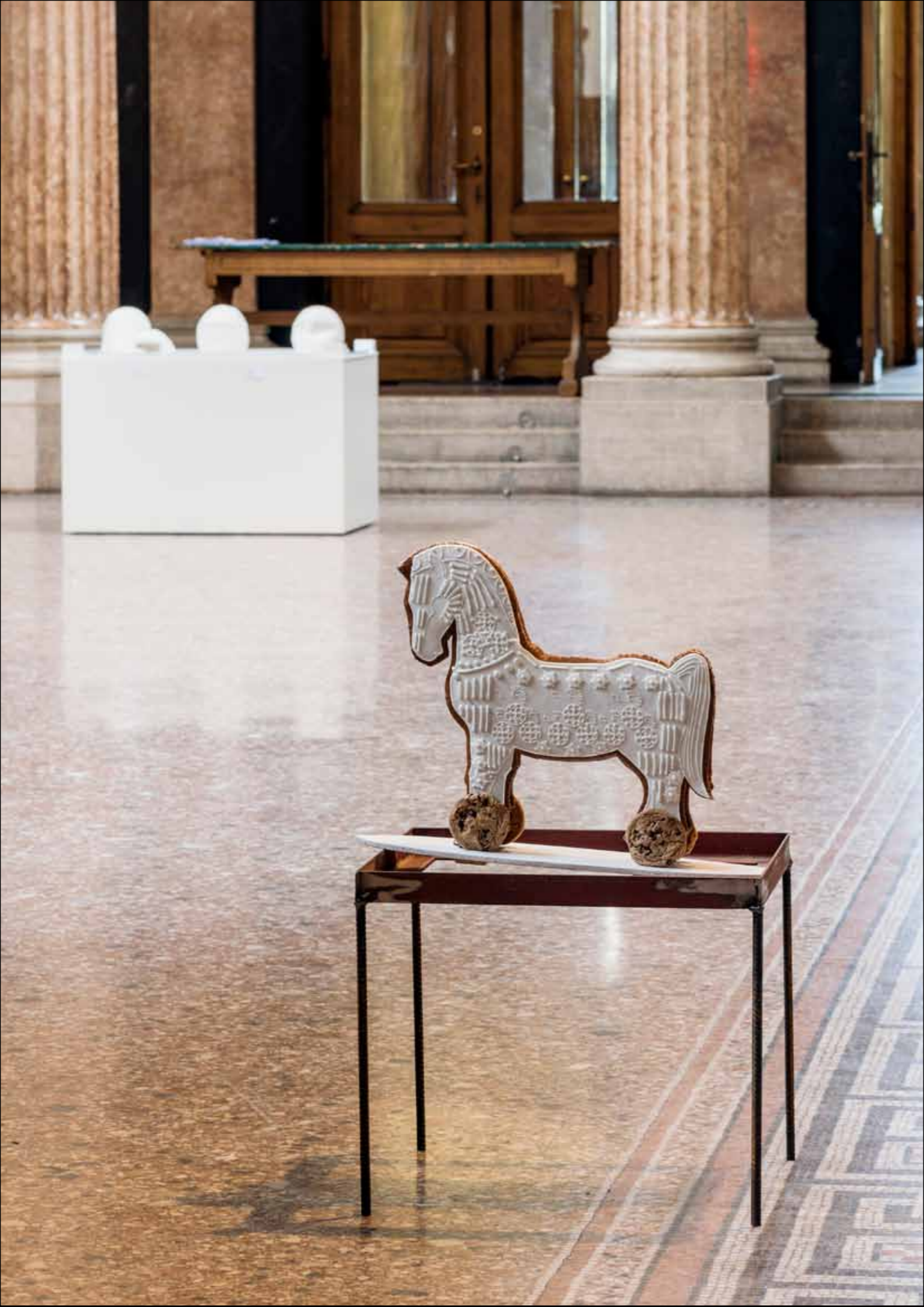
cookie (Trojaner), 2017 cookie, sugar, wood 40 x 40 cm