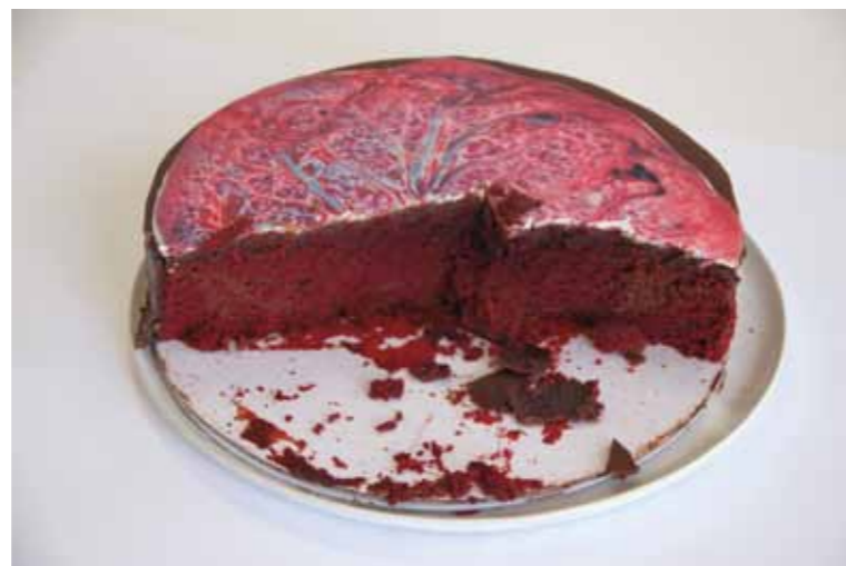
Marie Antoinette , 2012-2013 Zucker, Schokolade, Styropor 30 x 22 x 6 cm