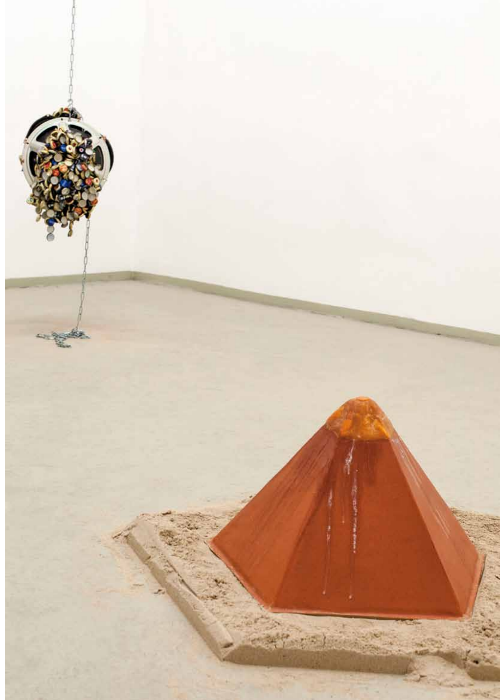
Ausstellungsansicht - Van Duijne VS Gumhold , 2015 D.U.O. Raum für Kunst und Medien, Wien